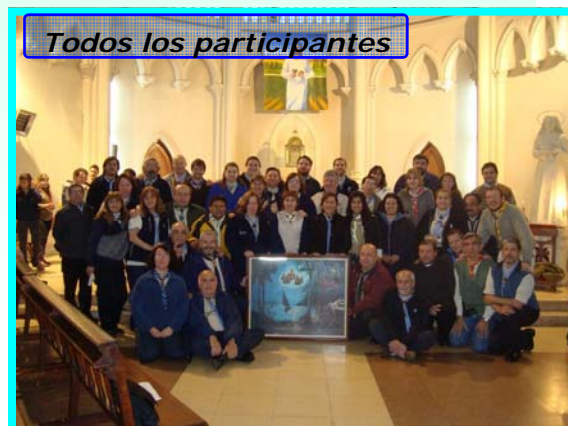
Todos los participantes

Con la invocación de ayuda a nuestro Gran Jefe ¡¡Siempre Listo!!